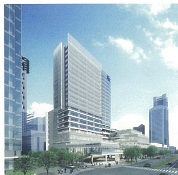
神奈川大学みなとみらいキャンパス完成イメージ図 (2021年開設予定)