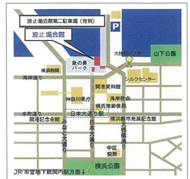
波止場会館 みなとみらい線日本大通り駅下車徒歩5分