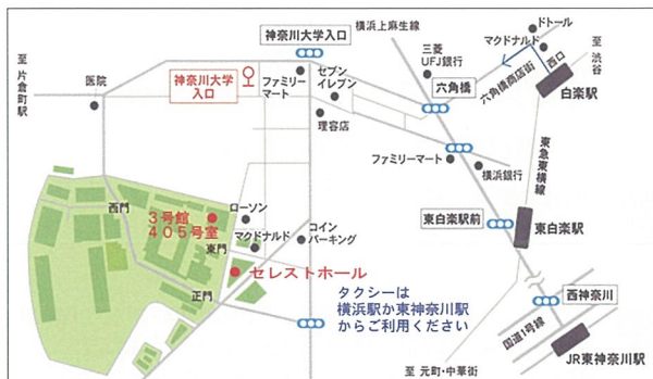
神奈川大学横浜キャンパス▶東急東横線白楽駅下車徒歩13分、横浜駅西口バスターミナル1番のりばから横浜市営バス神奈川大学入口下車

応募方法 先着順、9月10日(火) ~ 30日(月) までに「横浜外国人居留地研究会」ホームページからお申し込みください。